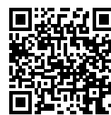
AMZ RACING TEAM

Az FS East nulladik napja a Formula Student alumni tagok nemzetközi találkozójáról szólt, amelyet első alkalommal, FS Alumni World Summit néven szerveztek meg. Az ide érkező volt FS csapattagok példája is bizonyítja, hogy a mozgalomban való részvétel komoly előnyt jelent a karrierépítés szempontjából: a világtalálkozó résztvevői voltak többek közt az Audi Sport, a Rimac Automobili és a Continental munkatársai. Korábbi csapattársai felkérésének tett eleget Kling Sándor, a Red Bull Racing mérnöke , aki személyes tapasztalatairól, a BME FRT-ből az F1 világába vezető útról tartott előadást az alumni tagokból álló közönségnek.